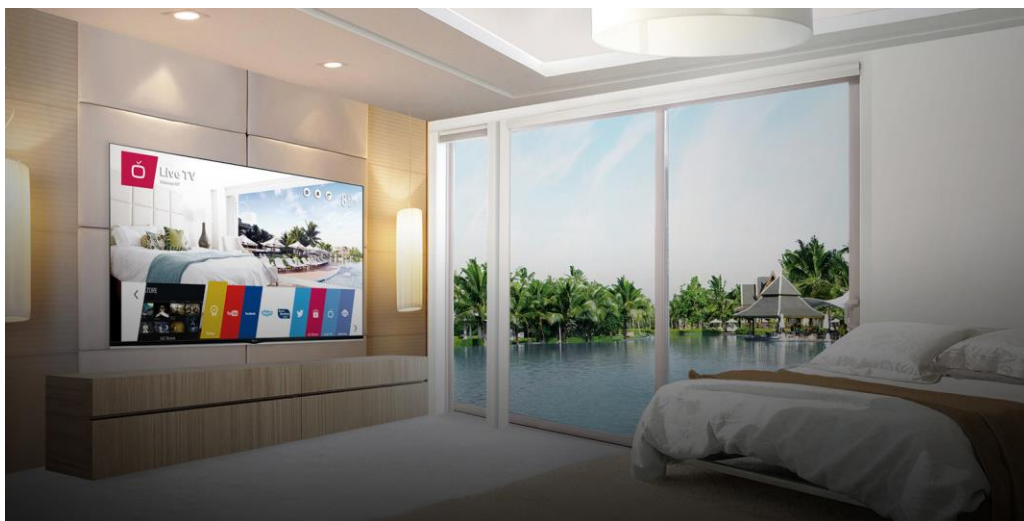
รูปภาพที่ 1 ระบบทีวีในโรงแรมที่มี Content Management System ดูแลและจัดการระบบทีวีได้ง่ายขึ้น

ในบทความที่แล้วได้มีการพูดถึงและอธิบายกันไปแล้วว่า ทำไมต้อง Hospitality TV คืออะไร ( https://www.hstn.co.th/content/9780/-hospitality-tv- ) และมีคุณสมบัติที่ดีกว่าทีวีทั่วไปอย่างไร และยังได้มีการพูดถึงความสามารถที่สำคัญอยู่ประการหนึ่งคือ สามารถทำโซลูชั่น (Solution) ได้ในบทความนี้จะเป็นการขยายคำจำกัดความของคำว่า การทำโซลูชั่นนั้นเป็นอย่างไร การทำโซลูชั่นในงานระบบทีวีในโรงแรม มีชื่อเป็นทางการว่า Content Management System และมีชื่ออย่างย่อว่า CMS